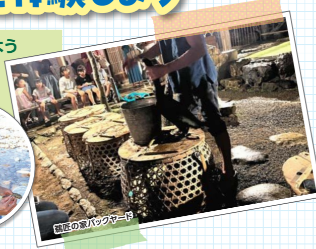
鵜匠の家バックヤード

旅行代金: おとな・子ども 各3,580円 対象年齢: 小学1年生以上 募集人員: 22名 (最少催行人員10名) 集合・解散場所: JR岐阜駅 雨天時は屋内でのプログラムに変更する場合があります