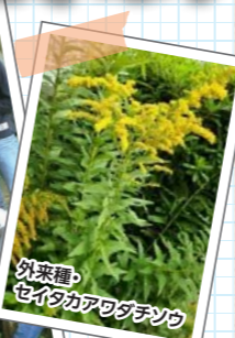
外来種・セイタカアワダチソウ